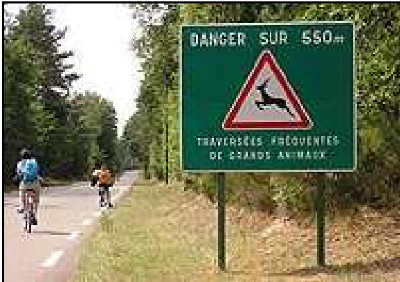
Panneau signalisation passage grand gibier