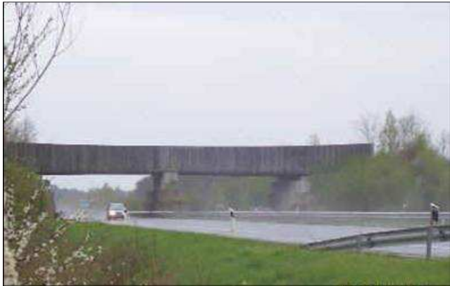
Passage à gibier sur autoroute